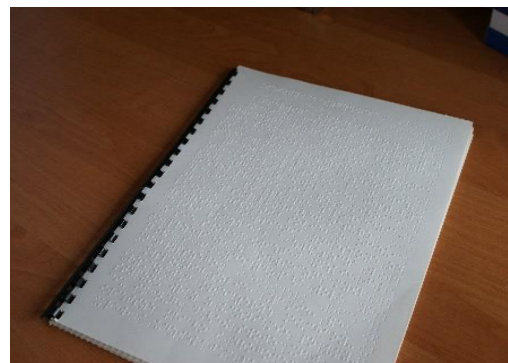
Gotowa publikacja w alfabecie Braille'a