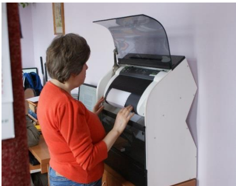
Transkrypcja tekstu na druk brajlowski